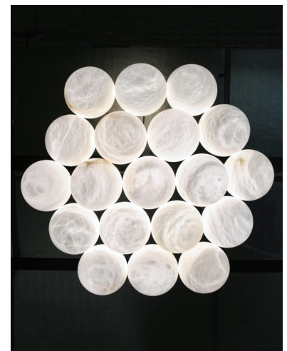
Non contractual picture / Photographie non contractuelle